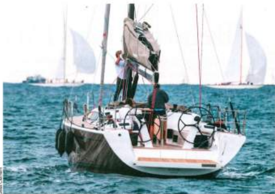
Sortie du Vieux-Port sur fond de Régates Royales, le nouveau Dehler s'harmonise avec l'ambiance du grand rendez-vous des classiques.

La profondeur de la pelle du safran du Dehler 46 en version Racing. Elle est proportionnée à la puissance du bateau avec 121 m 2 de toile au près plus 180 m 2 de gennaker ou 150 m 2 de spinnaker au portant.