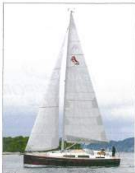
▲ Le foc autovireur explique le faible recouvrement de la voile d'avant.

est bordée d'équipets. Certains rangements ouverts auraient mérité des fargues plus hautes... La table à cartes, avec le tableau électrique, se situe sur bâbord. Elle est prolongée d'une banquette qui complète le carré sur tribord. A l'avant, la hauteur, tant assis que couché, confère un sentiment de volume précieux sur une unité de cette taille. Les vide-poches sur les côtés et en pied de lit, ainsi que les rangements de part et d'autre de la porte, accueilleront tous les effets personnels. Les deux cabines arrière sont parfaitement symétriques. Le grand plus, décliné sur toutes les unités de la série, est la luminosité offerte par un vaste hublot d'angle. Enfin, côté hygiène, la salle d'eau avec douche et WC est située à bâbord de la descente. L'ensemble est très réussi, en termes de volume mais aussi de fonctionnalité. Le WC peut devenir assise de douche ou zone humide pour se changer après un quart arrosé. Et c'est bien vu. Ces quelques heures passées à bord du Hanse 388 donnent une très bonne première impression du petit nouveau de la gamme. Il est fidèle aux ambitions de navigation facile et confortable et mériterait qu'on approfondisse la question à l'occasion d'une vraie croisière et d'un essai plus long. Texte : S. Sigrüst.